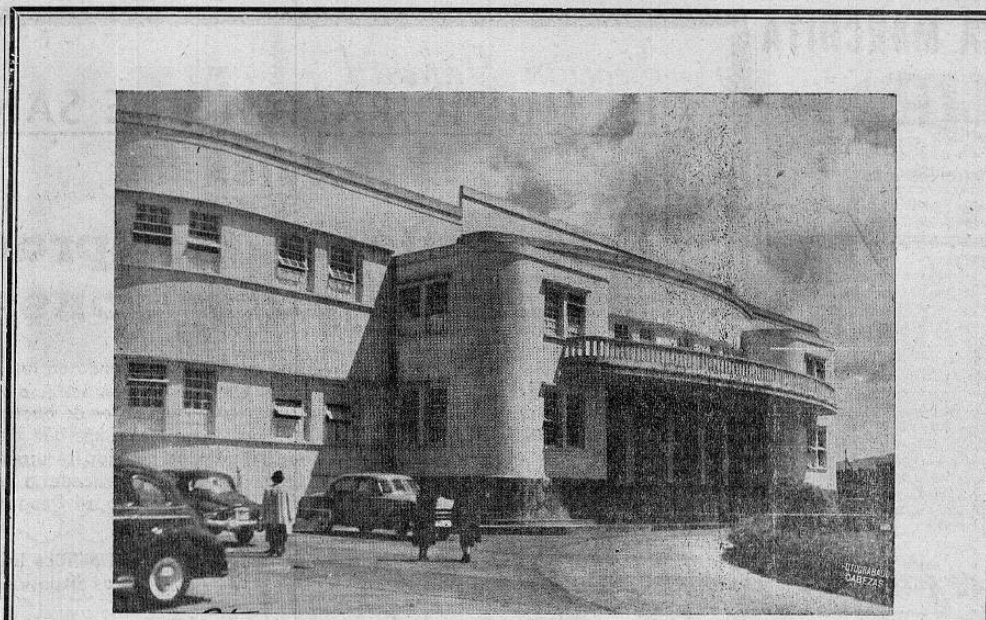
Hospital y Policlínico de la Caja de Seguro Social donde se atienden alrededor de 20.000 enfermos cada mes

Como que estos datos son relativamente nuevos, no se han podido determinar aún las causas por las