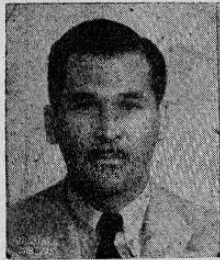
Lic. don Humberto Pacheco Vice Ministro de Seguridad Pública

"Trabaja este Ministerio con todo ahínco en la reorganización del tránsito, solucionando en lo posible, el grave y creciente problema de congestión de vehículos y los frecuentes accidentes".